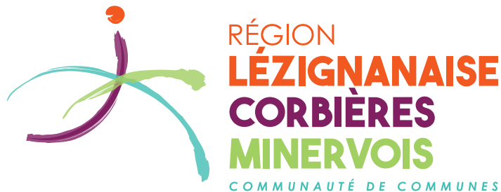
LE LOGOTYPE EN VERSION HORIZONTALE

Le logo de la Communauté de Communes « Région Lézignanaise Corbières Minervois » est chargé de sens puisqu'il évoque les principales caractéristiques du territoire. En effet, le trait bleu symbolise les fils d'eau qui irriguent la Communauté de Communes, l'Orbieu, l'Aude, le Canal du Midi, le trait violet la culture vigneronne, et le trait vert les paysages, les pâturages, les vignes et la ruralité. Le point orange quant à lui rappelle l'ensoleillement ainsi que la couleur chaude des sols de nos terroirs. L'ensemble retranscrit le dynamisme de la Communauté de Communes. Mais en soi, chacun est libre de sa propre interprétation.