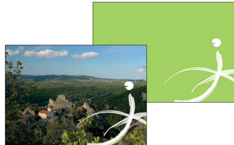
ÉLÉMENT GRAPHIQUE EN NUANCE DE BLANC