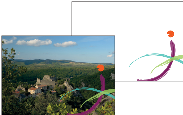
ÉLÉMENT GRAPHIQUE EN COULEURS

Si le fond ne permet pas une bonne lisibilité de l'élément graphique du logo en couleurs, c'est la version en nuance de blanc qui doit être utilisée.