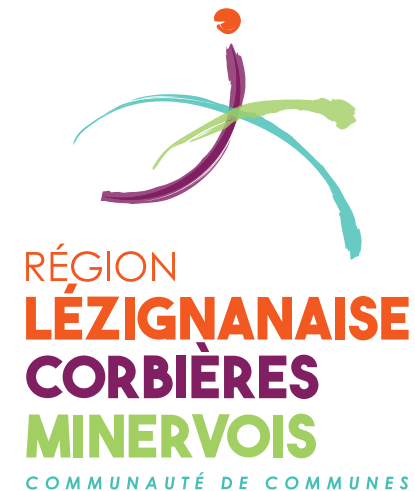
LE LOGOTYPE EN VERSION VERTICALE