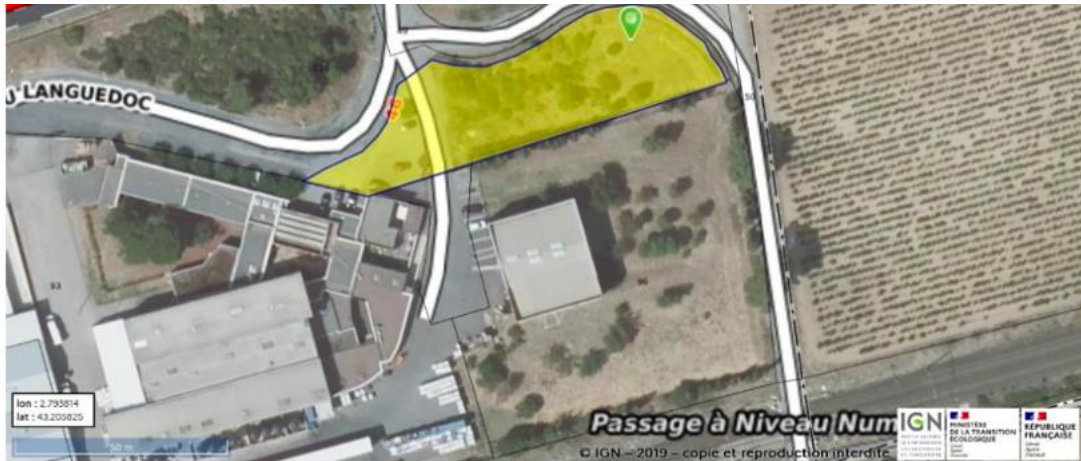
Figure 2. Détermination approximative de la fraction de parcelle intéressant la société ELIDIS

Cette fraction de parcelle peut être matérialisée, tel qu'il ressort d'un projet de division cadastrale comme suit: