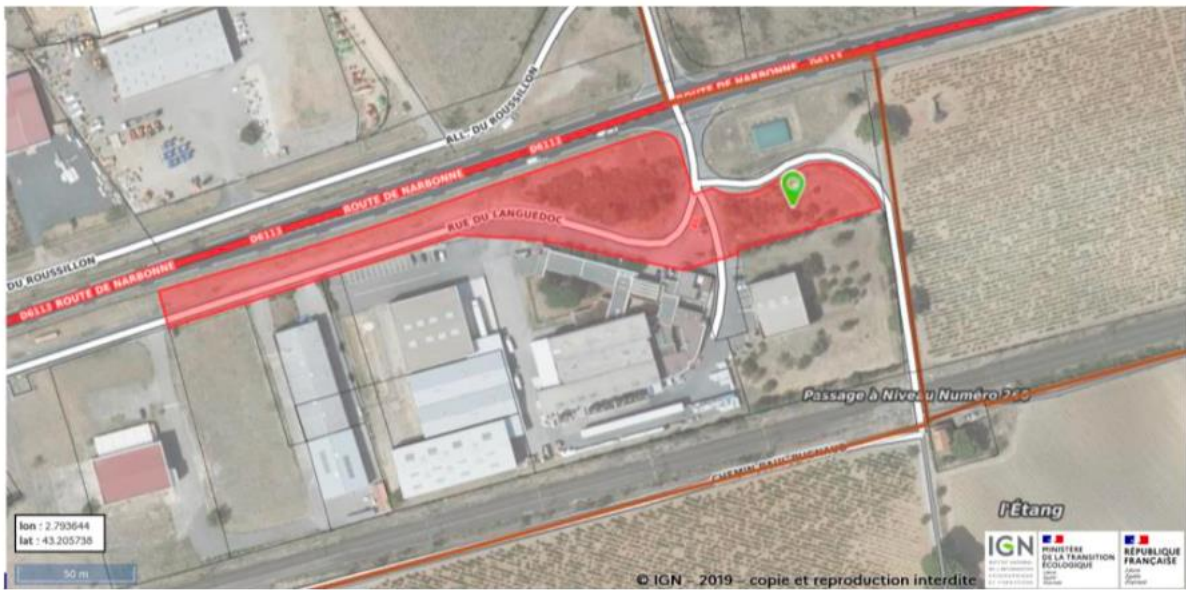
Figure 1. Matérialisation (rouge) de la parcelle AW 116

Cette fraction de parcelle peut être matérialisée, tel qu'il ressort d'un projet de division cadastrale comme suit: